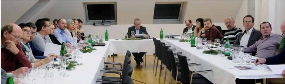
Das Plenum war sich bei wichtigen Vorhaben einig.