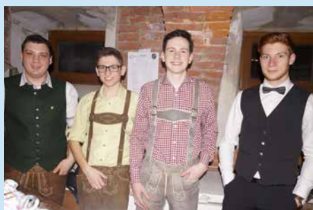
Die Landjugend Ilz freut sich auf Balltäger in der Disco.

Vorverkaufskarten für den Gemeindeball sind in den Bürgerservicestellen Ilz und Nestelbach, in den Raiffeisen-Bankstellen, bei der Steiermärki-