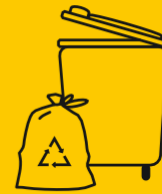
GELBE TONNE & GELBER SACK